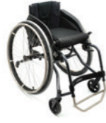
Panthera S3 Short Abd