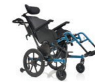
Progeo Tekna Tilt 2.0