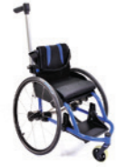
Panthera Micro 3