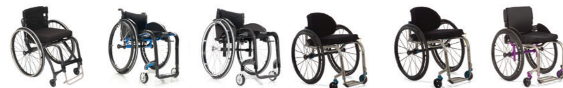
Panthera X Progeo Noir 2.0 Progeo Duke TiLite TR TiLite ZR TiLite ZRA