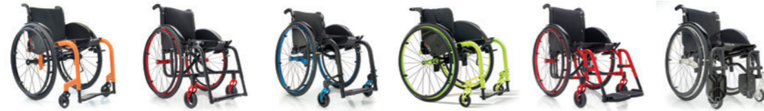
Progeo Ego Custom