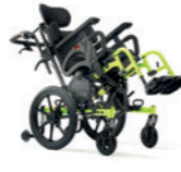
Progeo Tekna Tilt Jr