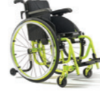
Progeo Exelle Junior