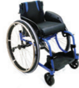
Panthera Bambino 3