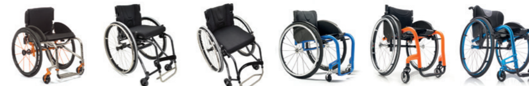
TiLite TRA Panthera U3 Panthera S3 Progeo Joker Energy Progeo Joker R2 Progeo Joker