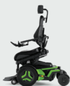
Sitslutning framåt Active Reach* 5–30° 20° och 30° kräver VS-benstöd