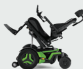
Sitslutning bakåt 0–50°