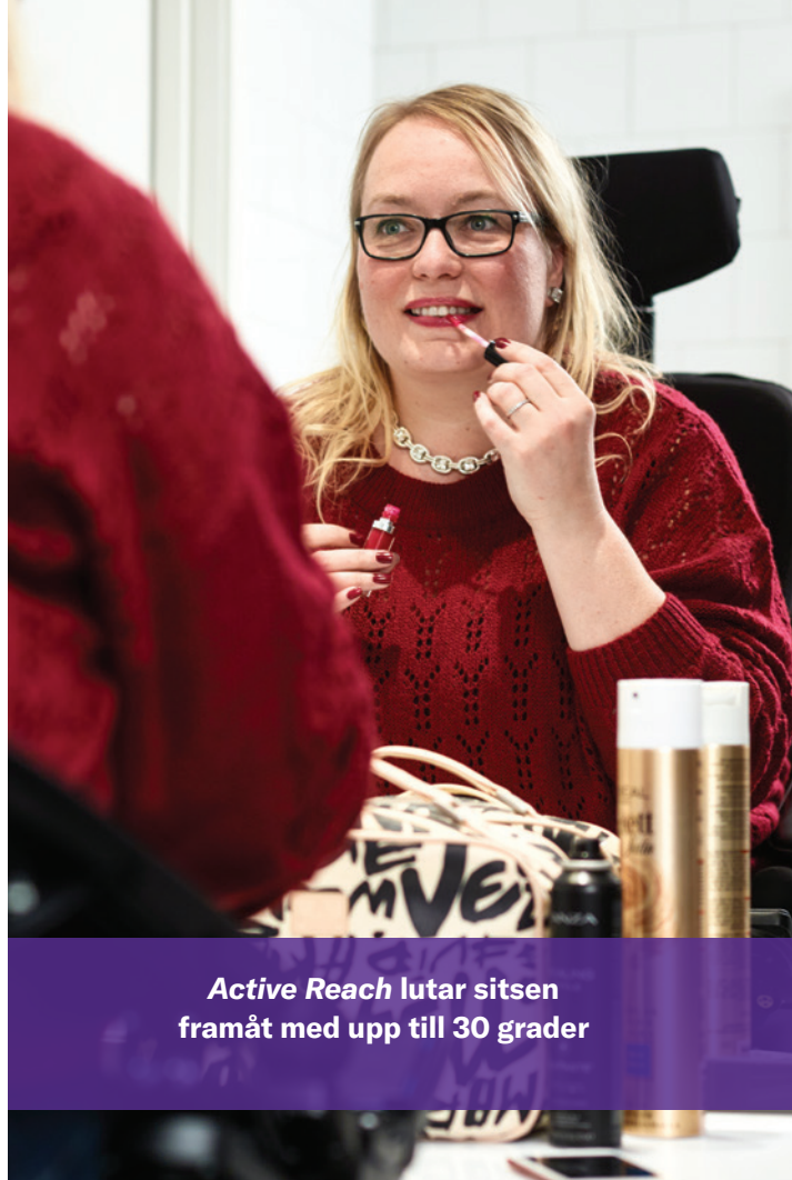
Active Reach lutar sitsen framåt med upp till 30 grader

Som tillval finns LED-lampor fram och bak som ger bättre ljus och synlighet.