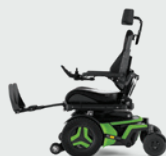
Elektriskt och manuellt benstöd 90–180°