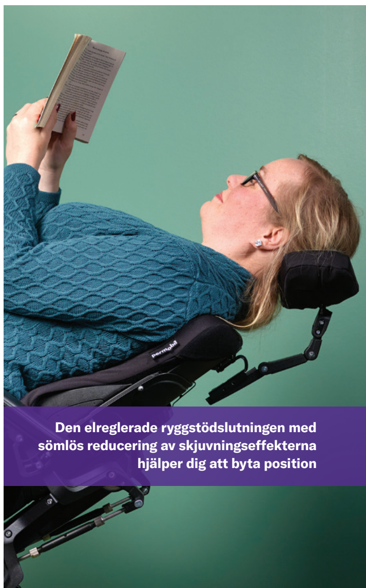
Den elreglerade ryggstödslutningen med sömlös reducering av skjuvningseffekterna hjälper dig att byta position