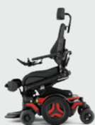
Voorwaartse kantelverstelling Active Reach* 5-20° Voor 20° is een VS-beensteun nodig