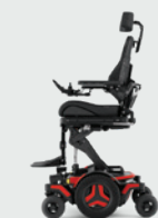
Zitlift Active Height 0-300 mm