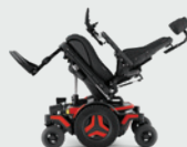
Achterwaartse kantelverstelling 0- 50°