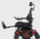
Elektrisch en handmatig verstelbare beensteun 90-180°