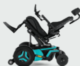
Achterwaartse kantelverstelling 0- 50°