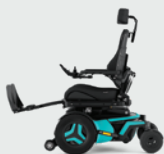
Elektrische en manuele Beensteun 90-180°