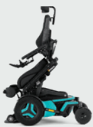
Voorwaartse kantelverstelling Active Reach* 5-45° Voor 20° tot 45° is een VS-beensteun nodig